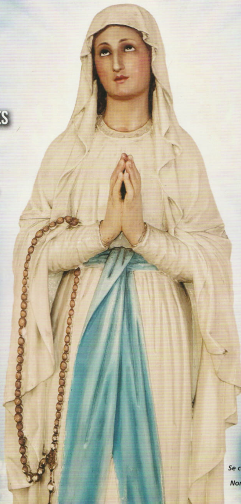
Imagen histórica de la Virgen de Lourdes. Se conserva en el Convento Asuncionista de Quinta Normal.

MADRE DE MISERICORDIA SALUD DE LOS ENFERMOS DESDE LA GRUTA DE LOURDES FORTALECE NUESTRA FÉ, NUESTRA ESPERANZA Y NUESTRO AMOR FRATERO.